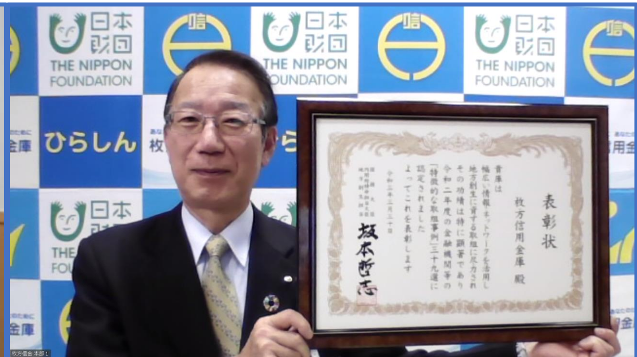
内閣府特命担当大臣（地方創生担当）坂本哲志氏