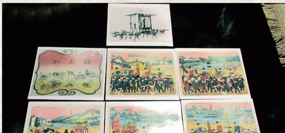
明治天皇大阪行幸図