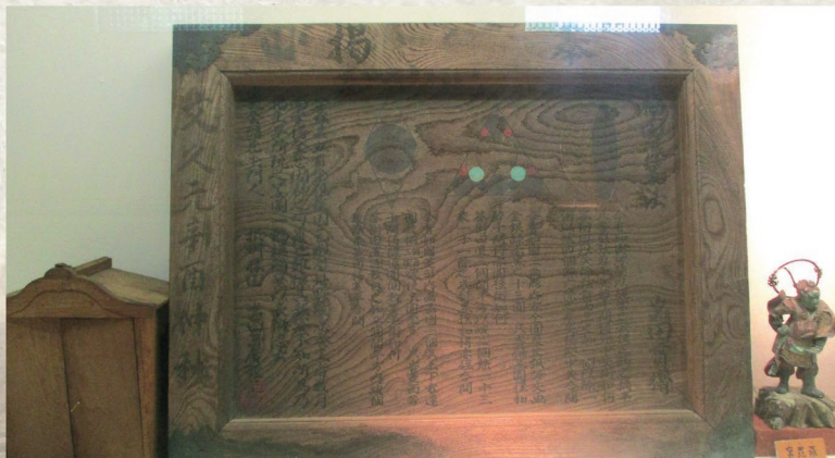
算額 (枚方市指定文化財)