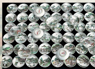
日本橋から大阪までの宿場が描かれた豆皿