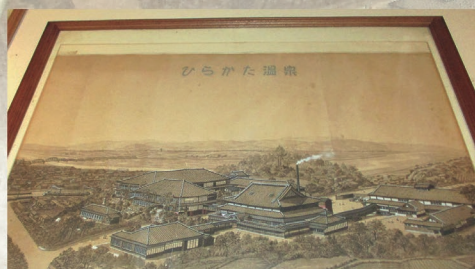
ひらかた温泉全体図