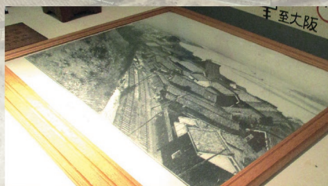
枚方大橋有無の比較写真