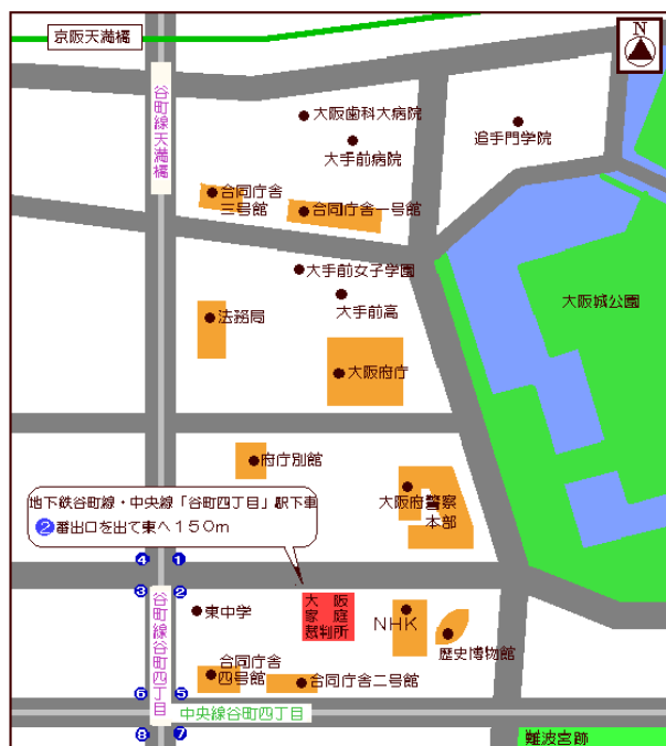
[大阪家庭裁判所周辺図]